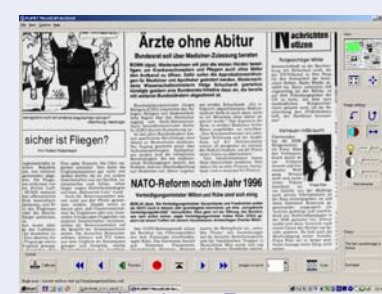
Vorschau -- Zoom