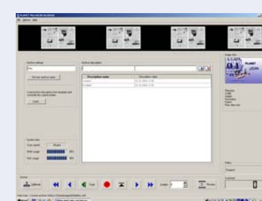
µSCAN Archivist Digitalisierung