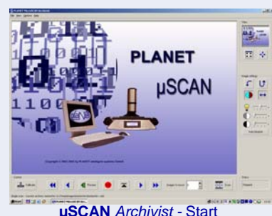
µSCAN Archivist - Start