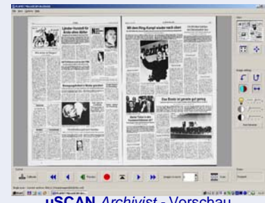
µSCAN Archivist - Vorschau